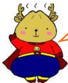
飾磨児童センター公式キャラクター「しかまん」